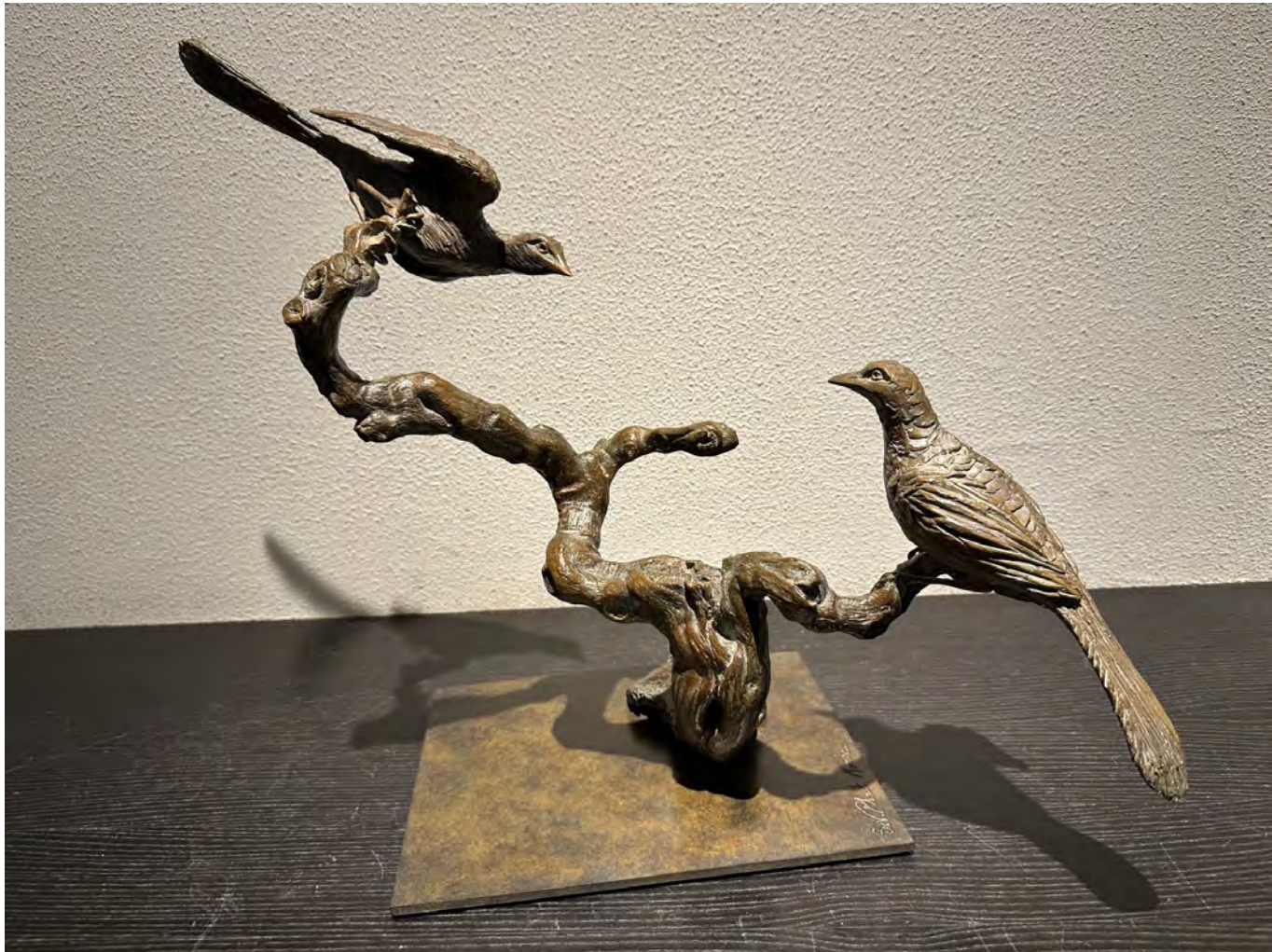
Dialogue - 46 x 58 x 28 cm