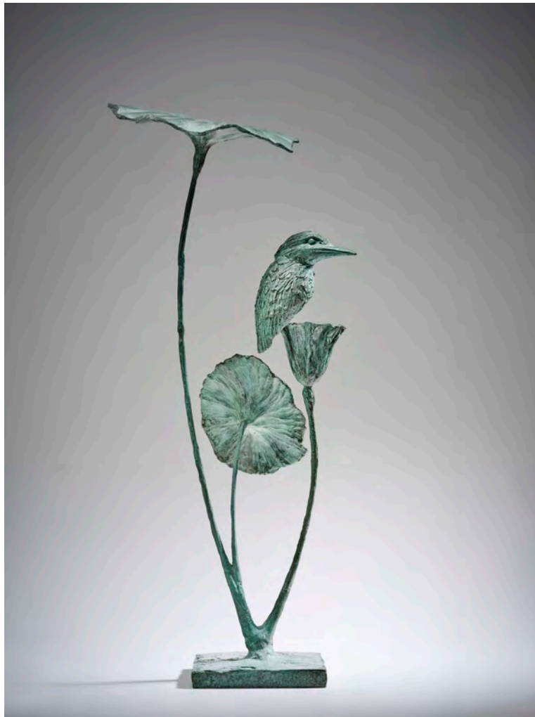
Lotus et martin-pêcheur - 52 x 26 x 18 cm