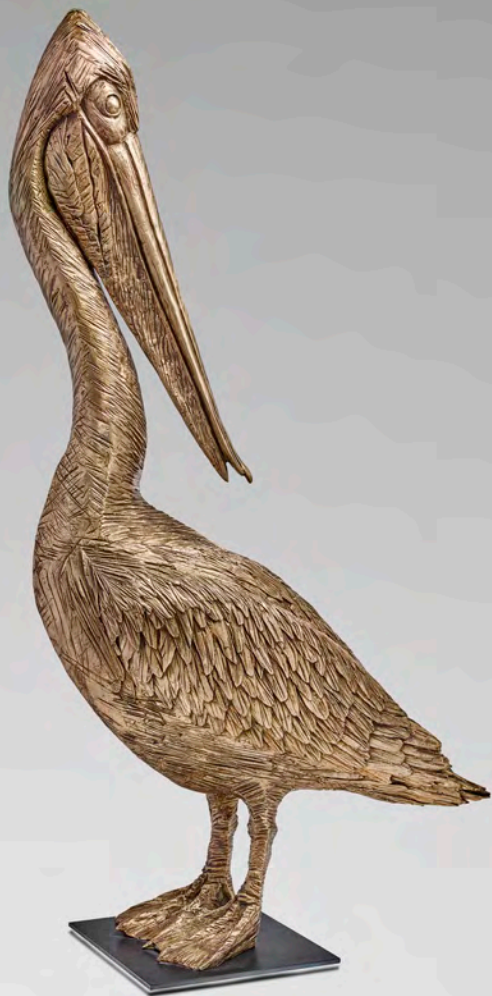
Pélican - 94 x 60 x 26 cm