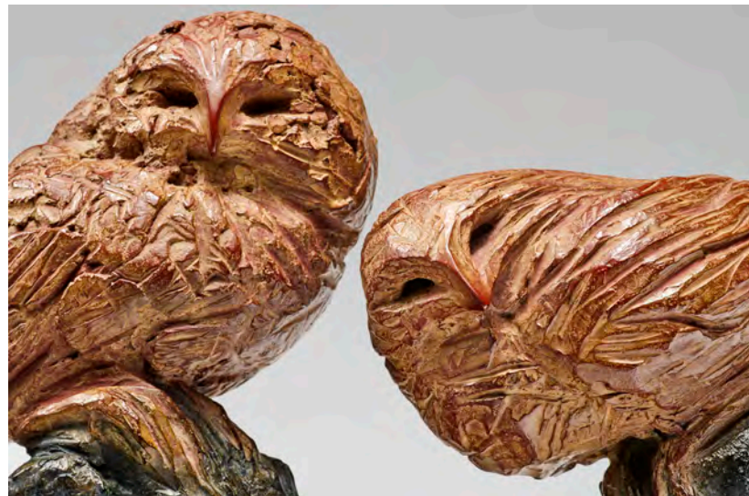
Petite et grande chouettes 26 x 19 x 10 cm (petite) - 33 x 20 x 11 cm (grande)