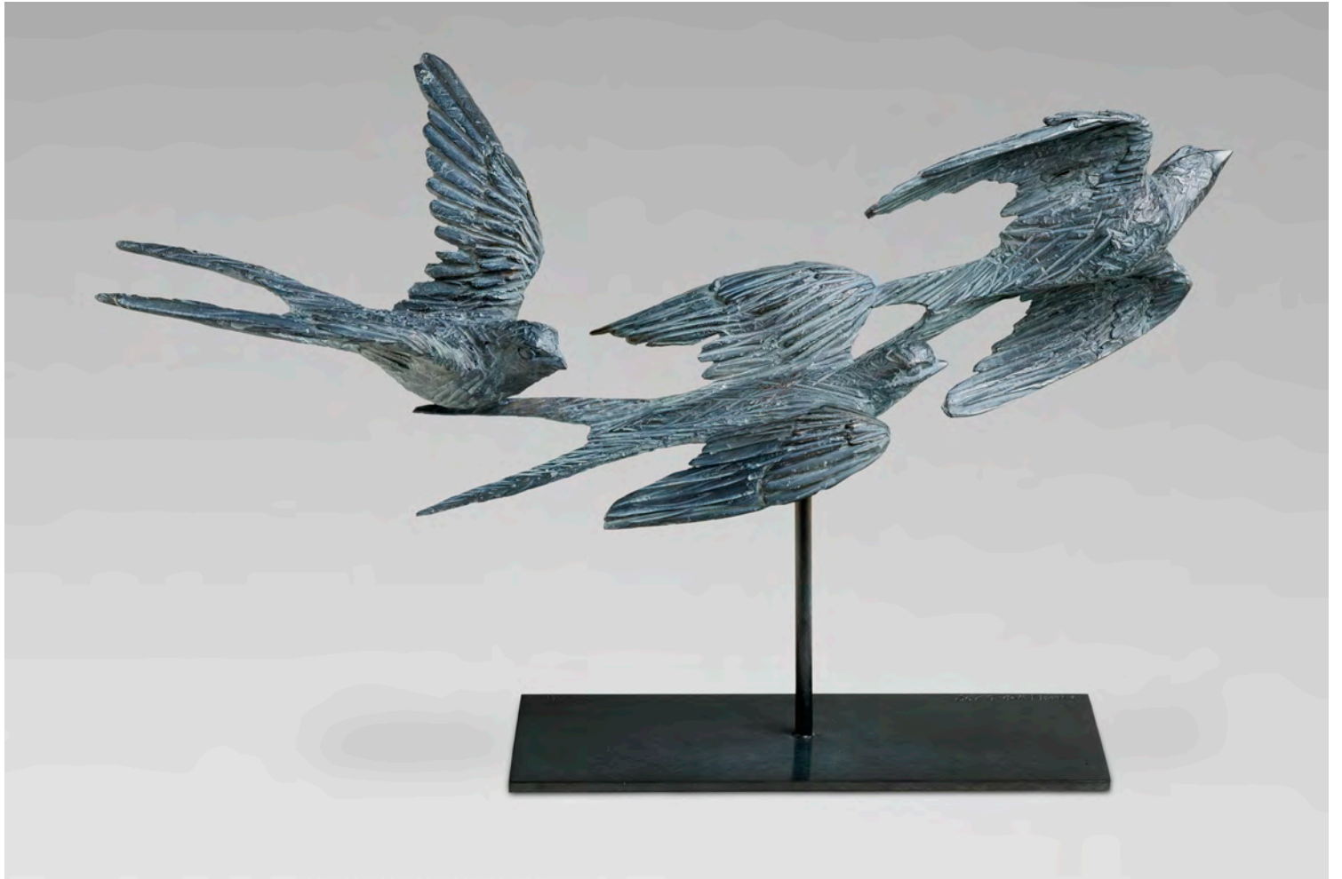
Vol d'hirondelles - 30 x 50 x 14 cm