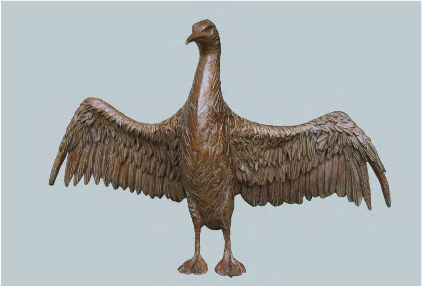
Cormoran - 53 x 80 x 36 cm