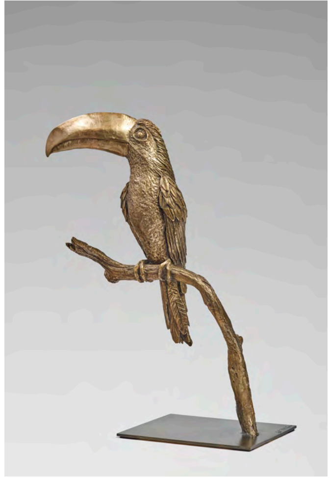
Toucan - 60 x 32 x 22 cm