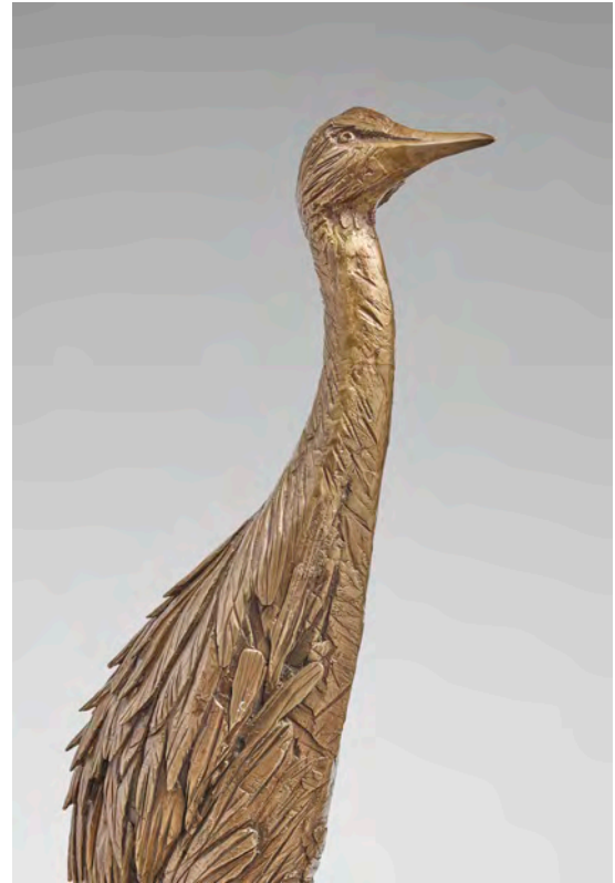
Grande grue - 124 x 52 x 21 cm