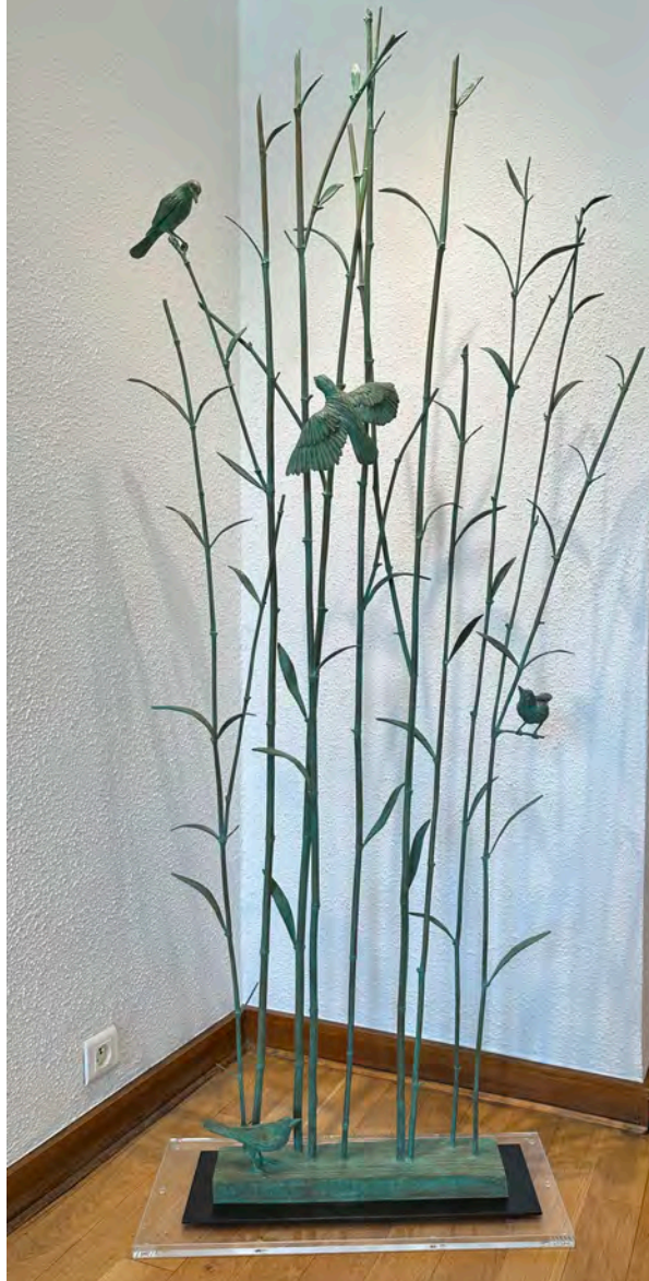
Bambous - 194 x 90 x 22 cm