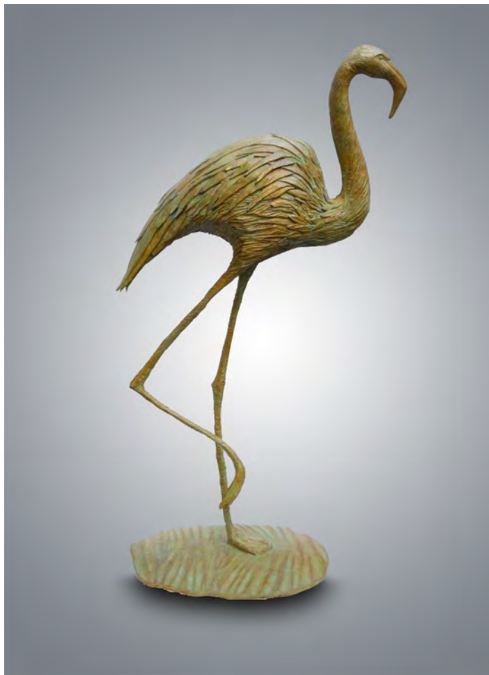
Flamant - 124 x 72 x 34 cm