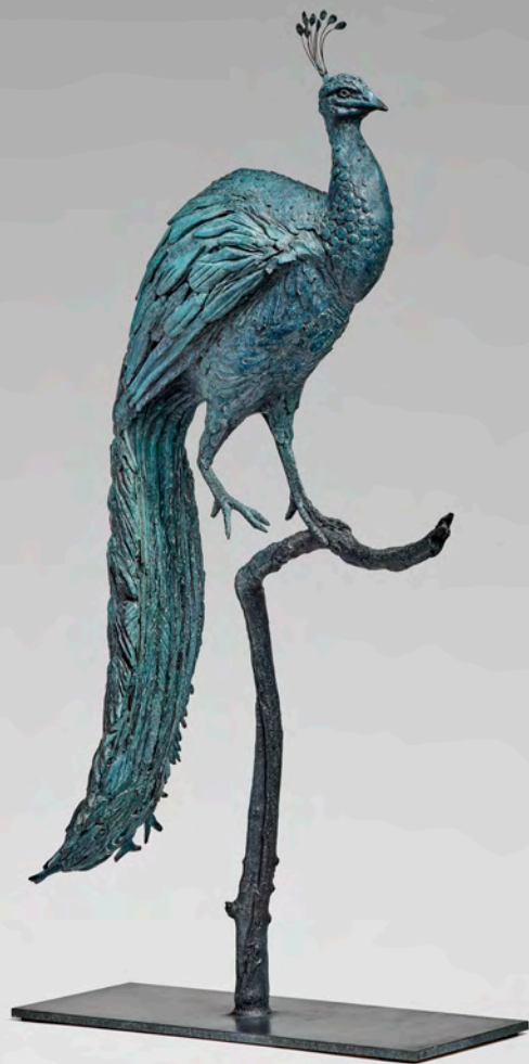
Paon - 88 x 40 x 18 cm