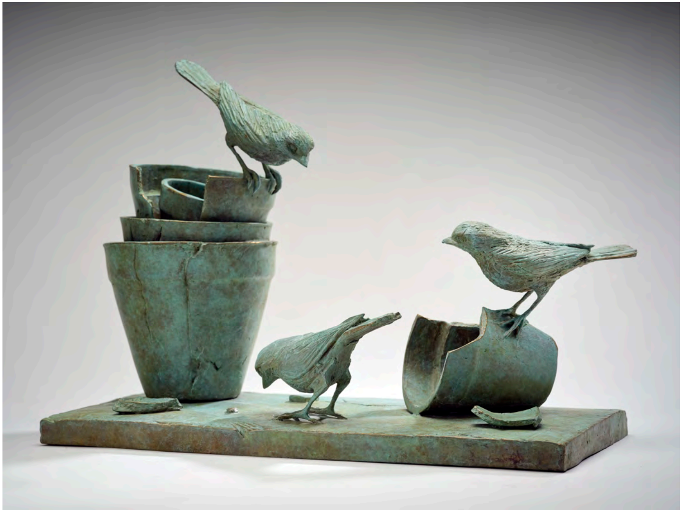
Un petit coin de paradis - 28 x 40 x 18 cm