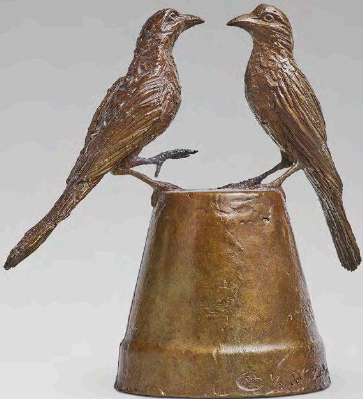
La rencontre - 20 x 18 x 12 cm