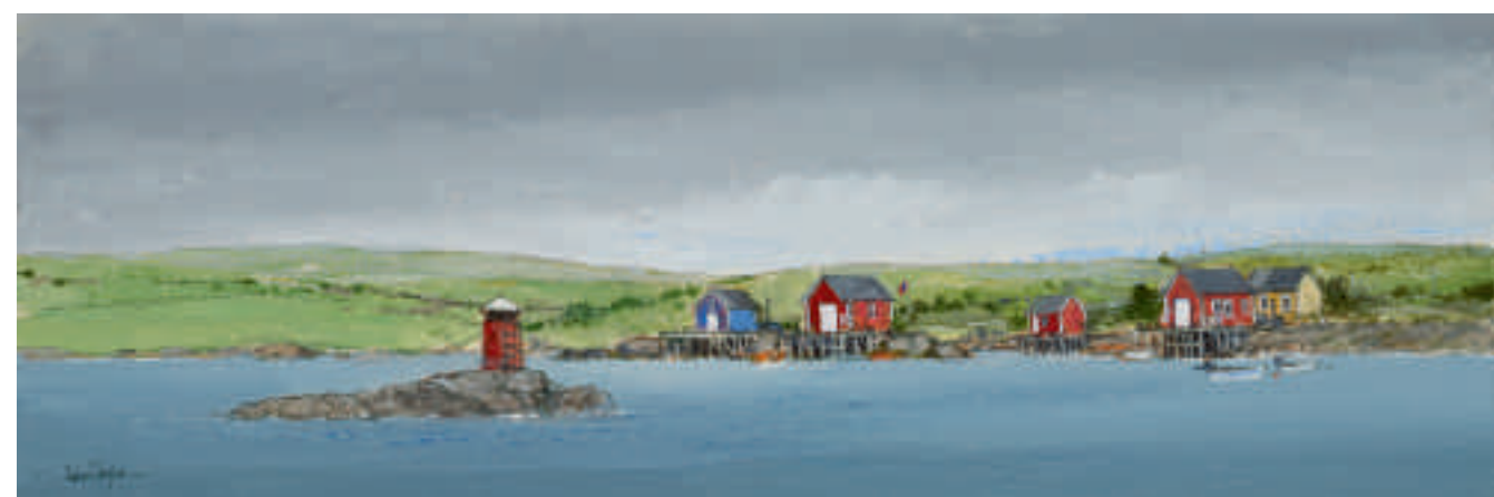
Paysage norvégien I 20 x 60 cm

Imprimerie SETO-Palaisse - ANGERS - 02 41 66 00 09