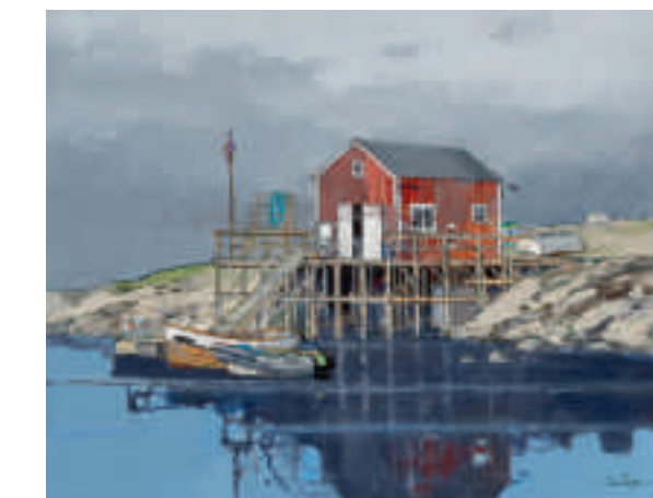
Le ponton en bois, Norvège, été 2011 65 x 50 cm