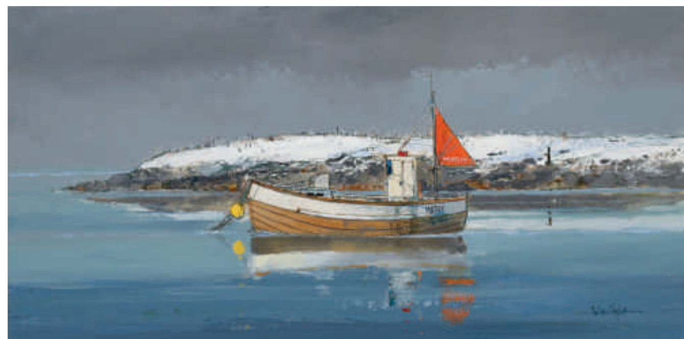
Bateau en bois en hiver, Norvège 60 x 30 cm