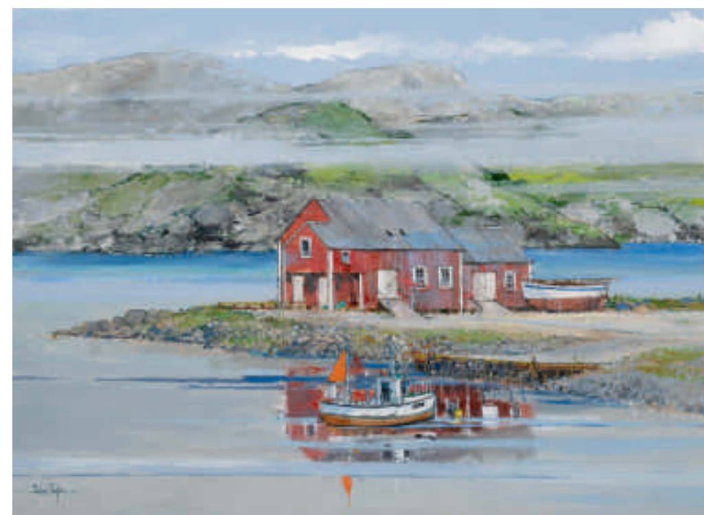
Brume matinale, îles Lofoten, Norvège 73 x 54 cm