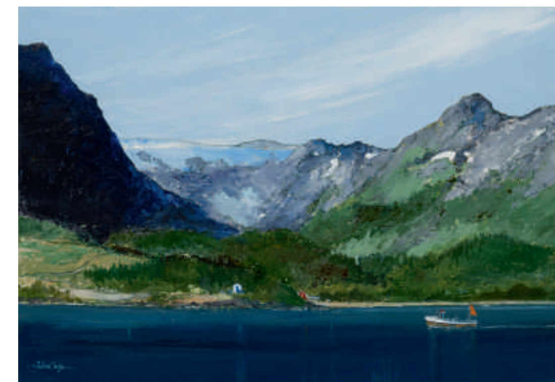
Fond de Fjord avec glacier, Norvège, été 2011 55 x 38 cm