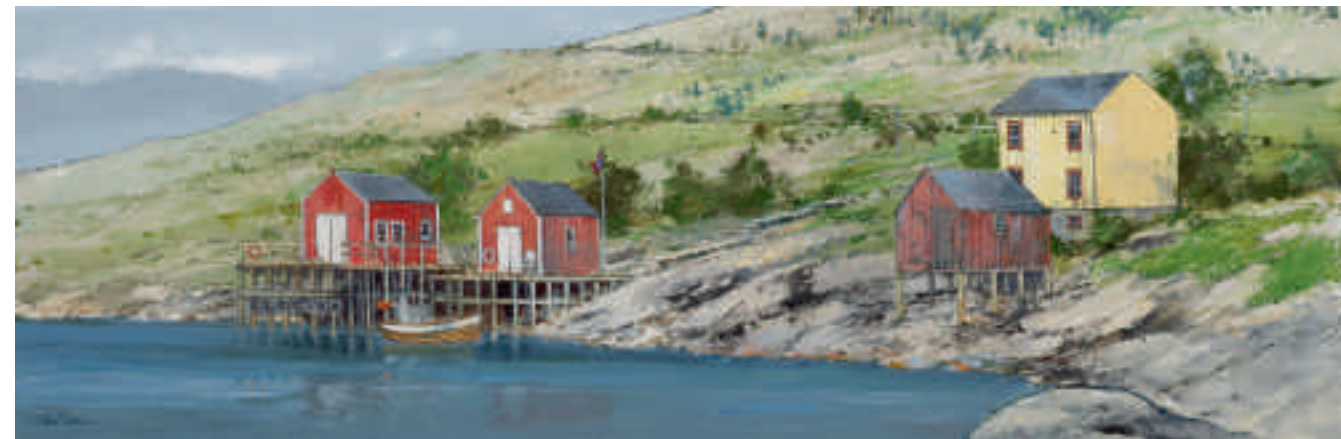
Été en Norvège 40 x 120 cm