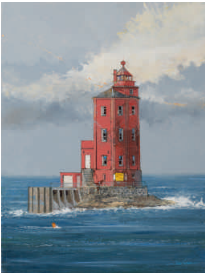
Le phare de Kjeungskjaer vu de l'Express Côtier, Norvège 73 x 54 cm