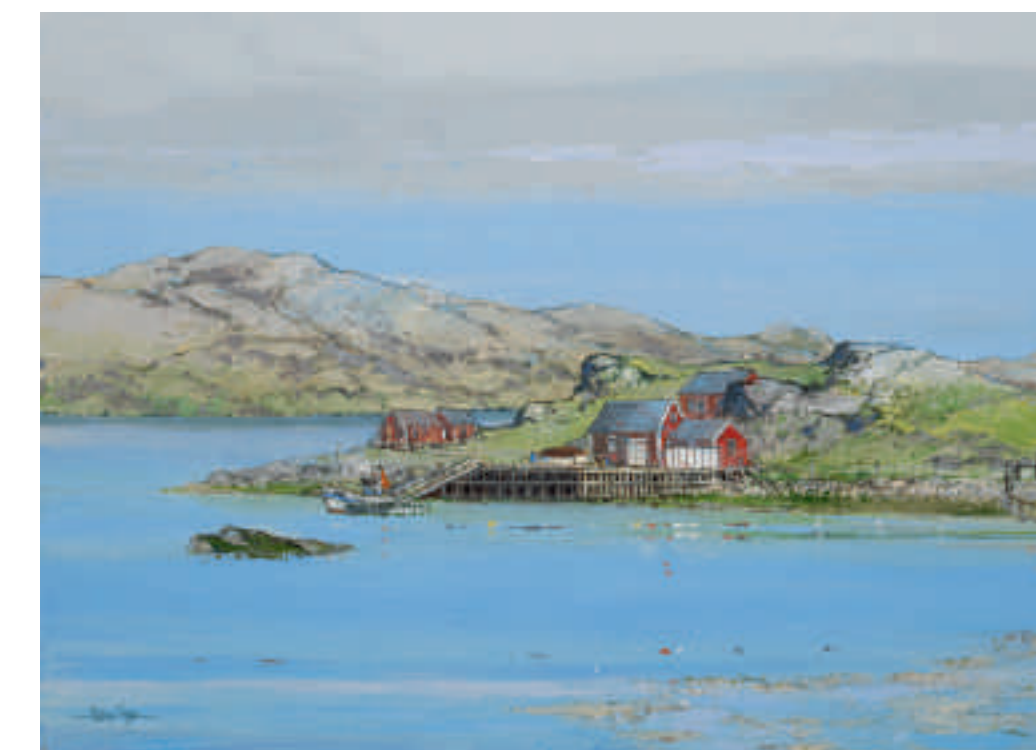
Lumière du matin, Norvège 73 x 54 cm

Jean-Luc Couillaud a le plaisir de vous inviter à l'exposition des œuvres de