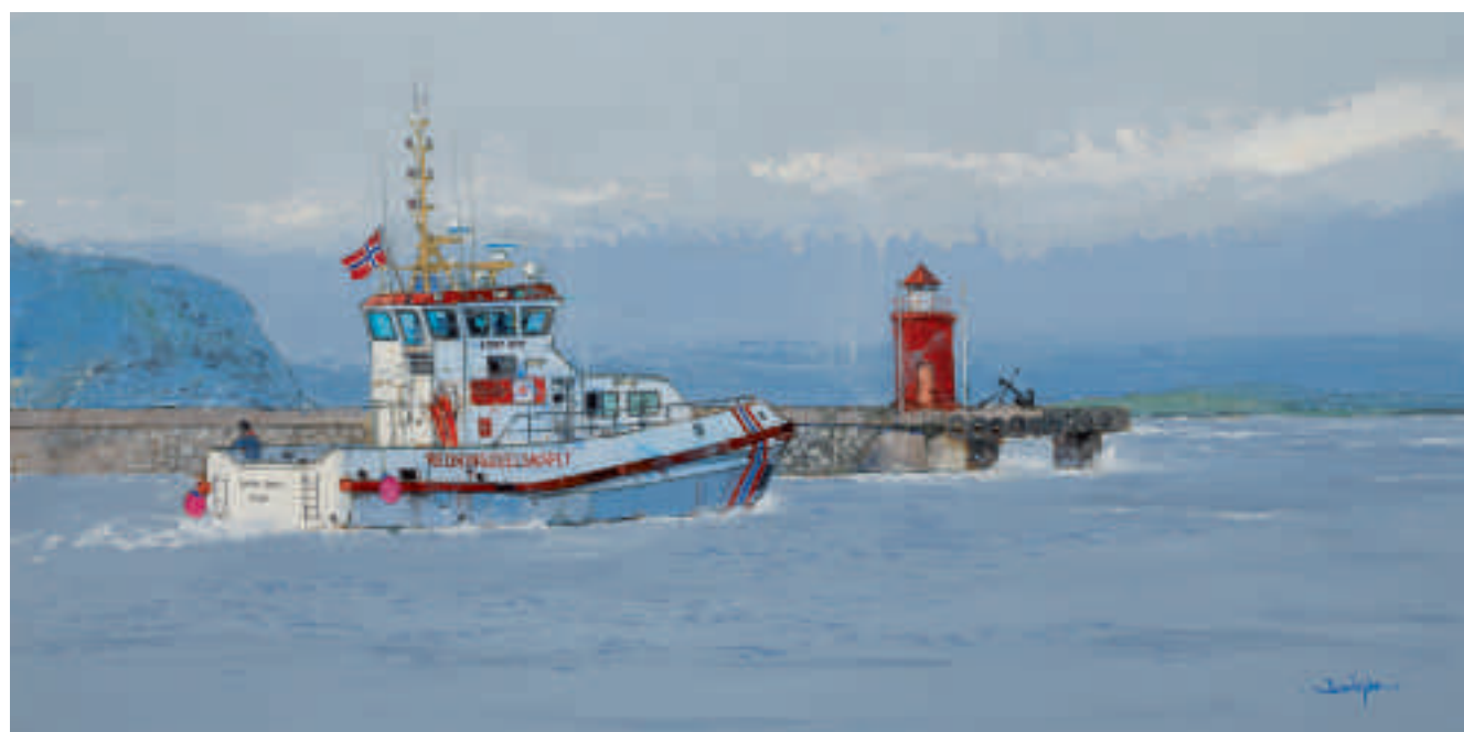
Vedette norvégienne de secours en mer 100 x 50 cm