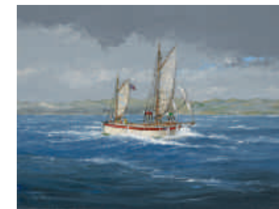
Le Ketch, Colin-Archer dans les îles Vesteralen, Norvège 65 x 50 cm