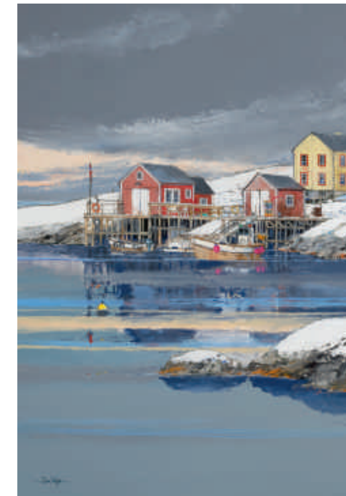
Ciel d'hiver en Norvège 116 x 81 cm