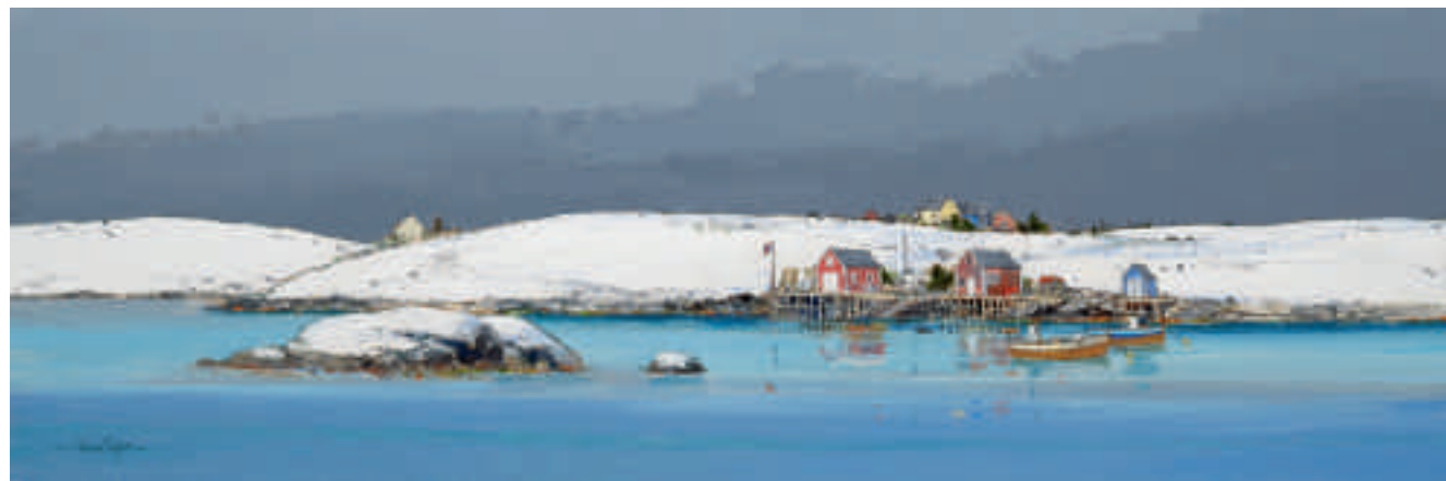
Hiver en Norvège 40 x 120 cm