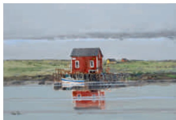
Petite maison de pêcheur, archipel Vega, Norvège 55 x 38 cm