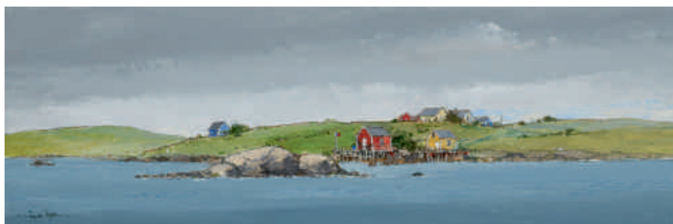
Dans les îles Lofoten, Norvège 20 x 60 cm