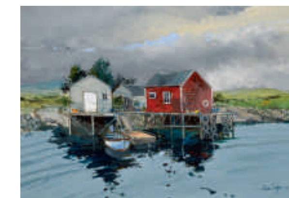
Ciel d'orage, archipel Vega, Norvège, été 2011 55 x 38 cm