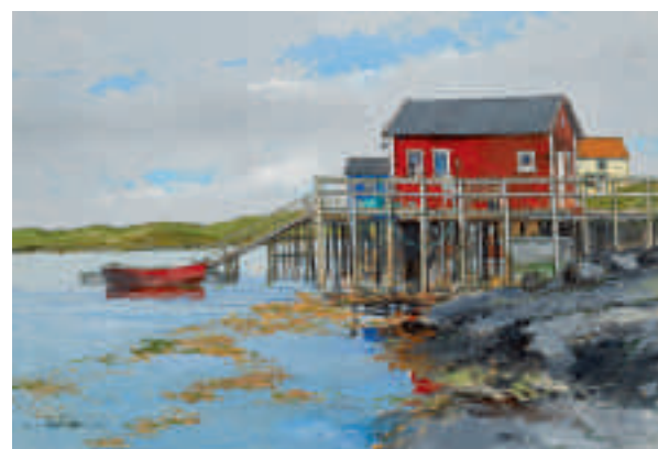
Maison de pêcheur, archipel Vega, Norvège 55 x 38 cm