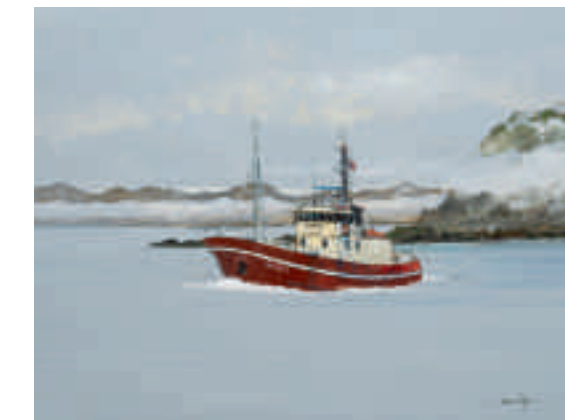
Bateau de pêche dans la brume norvégienne 61 x 46 cm